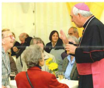
mit den Stuttgarter Katholiken und Herbstfest in Stella Maris

10:00 Uhr Pontifikalgottesdienst in St. Eberhard Königstraße, Stuttgart-Mitte, anschließend Bustransfer nach Stella Maris, Hohenzollernstr. 11, unter der Karlshöhe